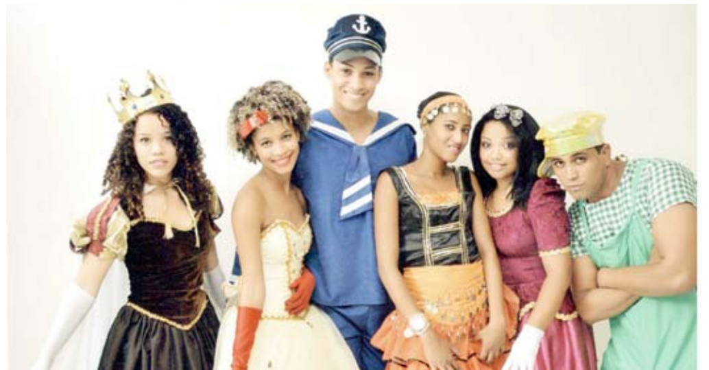
O jovem elenco da peça "Leituras e Travessuras é uma Gostosura", amanhã no Margarida Ribeiro.